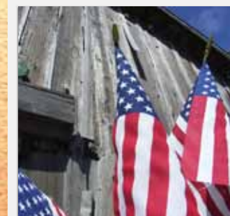
Made in the U.S.A.!

消化吸収に。体を温め胃腸の働きを活発にするしょうがは、古代ギリシャではパンとともに食されていました。しょうがは食べものが腸内を通過するのを助け、胆汁を増加する働きがあるとされています。サプリメントの吸収をより効果的にします。