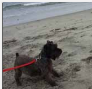
Play with me! I'm a fast runner!

ニュージーランドのマオリ族が「奇跡の貝」と呼んでいる緑イ貝。たんぱく質やミネラルが豊富です。魚の軟骨同様、glycosaminoglycans という有効成分が含まれていますが、これは関節の結合組織を構成している重要な要素です。